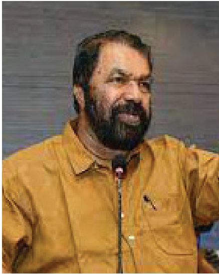
കോടി രൂപയുടെ വികസനമാണ് ഇക്കാലയളവിൽ ഉണ്ടായത്. കിഫ്ബി

പൊതുവിദ്യാലയങ്ങളുടെ അടിസ്ഥാന സൗകര്യ വികസനത്തിൽ കഴിഞ്ഞ ഏഴ് വർഷം കൊണ്ട് സംസ്ഥാന സർക്കാർ വിപ്ലവകരമായ മാറ്റമാണ് ഉണ്ടാക്കിയതെന്ന് പൊതുവിദ്യാഭ്യാസ മന്ത്രി വി. ശിവൻകുട്ടി.