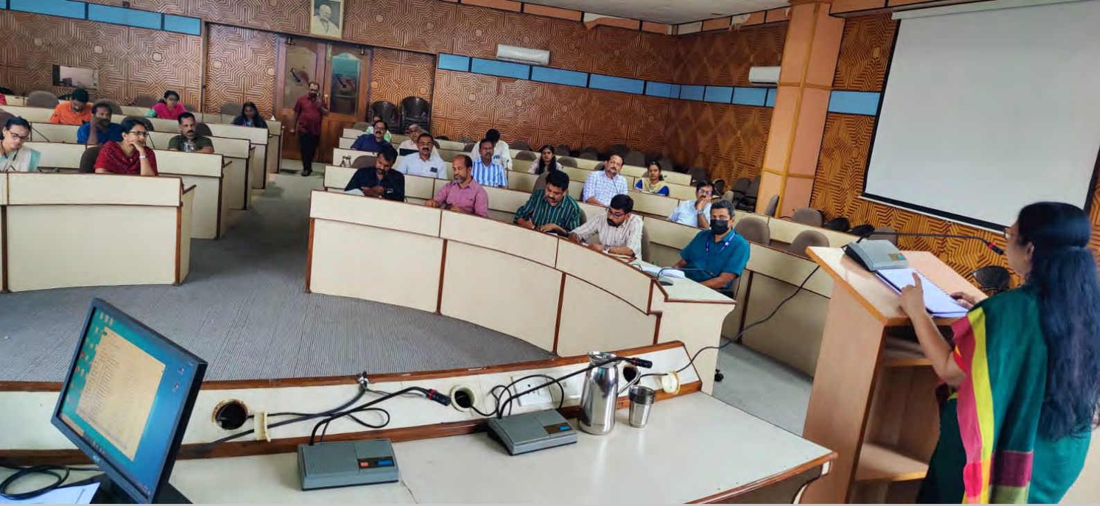
നവകേരളം കർമ്മപദ്ധതി പ്രവർത്തനങ്ങൾ ജില്ലാടിസ്ഥാനത്തിൽ വിലയിരുത്തുന്നതിനായി ചേർന്ന സംസ്ഥാനതല അവലോകന യോഗം