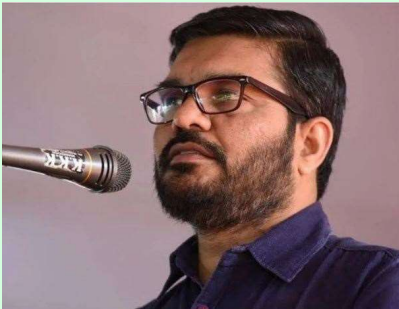
ക്കാൾ അപകടം എന്ന കാര്യം ബോധ്യപ്പെട്ടാൽ ഈ എതിർപ്പ് ഇല്ലാതാകും.

ഹരിത ട്രിബ്യൂണലിന്റെ അംഗീകാരം നേടാൻ കേരളത്തിന് കഴിഞ്ഞു. കോടിക്കണക്കിന് രൂപയാണ് ശുചിത്വ രംഗത്തെ വീഴ്ചകളുടെ പേരിൽ വിവിധ സംസ്ഥാനങ്ങൾക്ക് ട്രിബ്യൂണൽ പിഴ ചുമത്തിയിരിക്കുന്നത്. ഒരു പ്രദേശത്ത് മാലിന്യ സംസ്കരണ പ്ലാന്റ് ആരംഭിക്കാൻ തീരുമാനിക്കുമ്പോൾ തന്നെ പ്രദേശവാസികളിൽ നിന്ന് എതിർപ്പ് ഉയരുന്നുണ്ട്. എന്നാൽ സംസ്കരിക്കാത്ത മാലിന്യമാണ് പ്ലാന്റിനേ