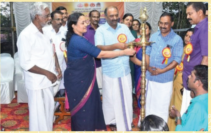
മികച്ച സൗകര്യങ്ങളാണ് സർക്കാർ ആശുപത്രികളിൽ നടപ്പാക്കുന്നതെന്ന് ധനകാര്യ മന്ത്രി കെ.എൻ. ബാലഗോപാൽ അധ്യക്ഷ പ്രസംഗത്തിൽ പറഞ്ഞു.

ആർദ്രം മിഷനിലൂടെ രോഗീസൗഹൃദ അന്തരീക്ഷം സർക്കാർ ആശുപത്രികളിൽ ഉറപ്പാക്കിയതായി ആരോഗ്യ വകുപ്പ് മന്ത്രി വീണാ ജോർജ്ജ്. ആർദ്രം പദ്ധതിയിൽ ഉൾപ്പെടുത്തി 37.5 ലക്ഷം രൂപ ചെലവിൽ കൊല്ലം ജില്ലയിലെ കുളക്കട സാമൂഹികാരോഗ്യ കേന്ദ്രത്തെ ബ്ലോക്ക് കുടുംബാരോഗ്യ കേന്ദ്രമായി ഉയർത്തുന്നതിന്റെ ഉദ്ഘാടനം നിർവഹിക്കുകയായിരുന്നു മന്ത്രി. കേരളത്തിലെ ആരോഗ്യ മേഖലയെ ശക്തികരിക്കുന്നതിന്റെ ഭാഗമായി ആശുപത്രികളിൽ ഓൺലൈൻ സേവനം നടപ്പാക്കുമെന്നും മന്ത്രി പറഞ്ഞു.