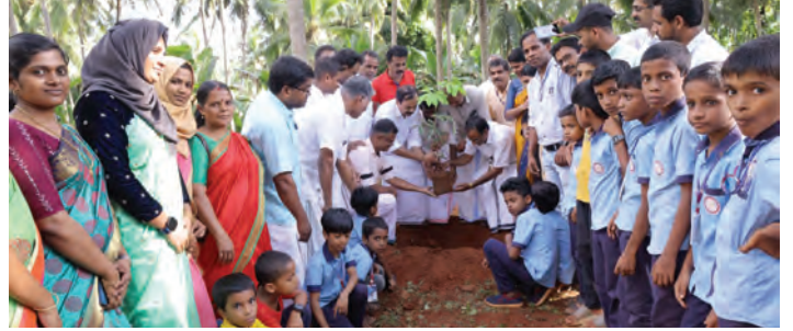
യിൽ അദ്ധ്യക്ഷത വഹിച്ചു. ആറ് സെന്റ് സ്ഥലത്താണ് പച്ചതുരുത്ത് നിർമ്മിക്കുന്നത്.